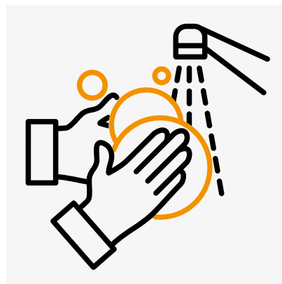
Hände regelmäßig waschen