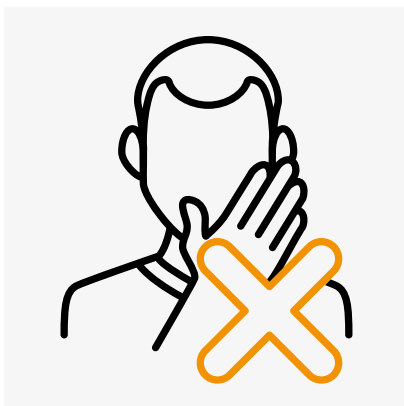
Möglichst nicht ins Gesicht fassen