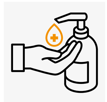
Beim Betreten und Verlassen Hände desinfizieren