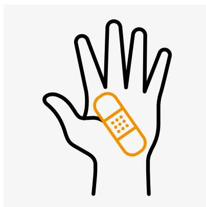
Wunden angemessen abdecken